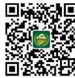
北京金英杰医考课程